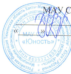
График выдачи продуктовых наборов родителям (законным представителем) профильного спортивно- оздоровительного лагеря с дневным пребыванием детей и подростков в заочном формате с использованием дистанционных технологий на базе МАУ СШОР «Юность».